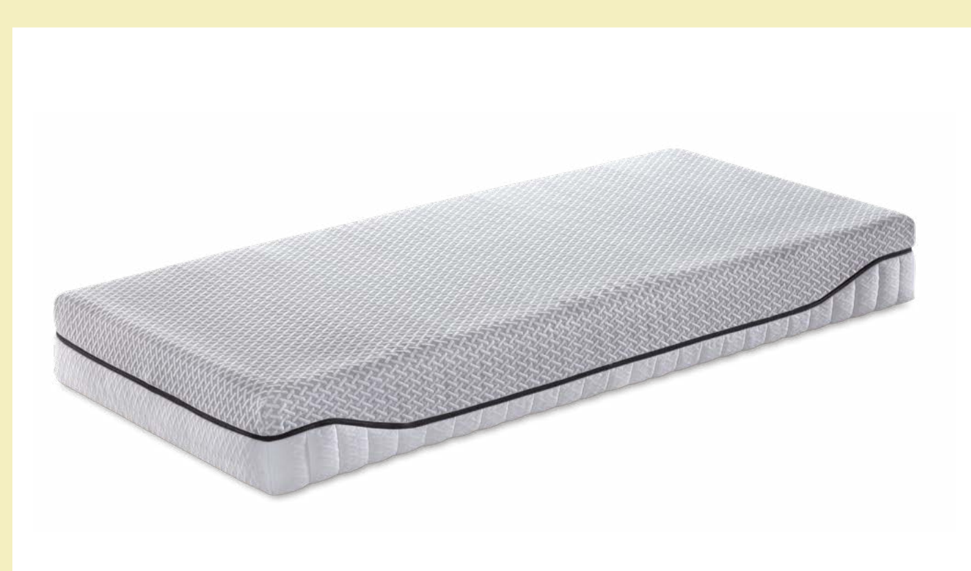
DUO KLIMA mit Micro Tencel®